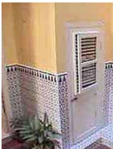
LOS BALCONES San Ignacio 454, e/Sol y Santa Clara, à deux rues de Plaza Vieja dans VIEJA.