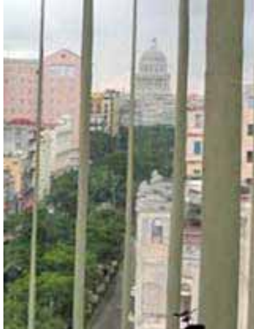
EVORA RODRIGUEZ Prado 20, e/ San Lazaro y Carcel, angle du Paseo de Prado dans VIEJA.