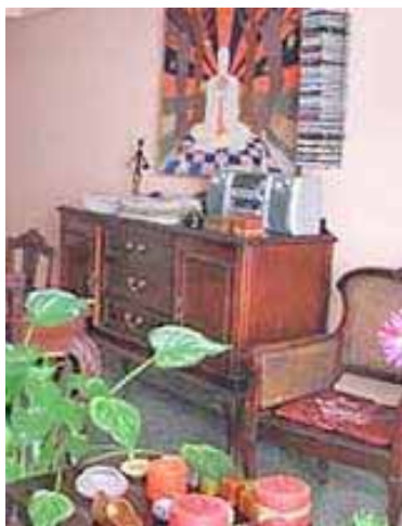
CASA LUNASS San Francisco 464 (5), e/ Zanja y Valle, à 700m du Habana Libre dans CENTRO.