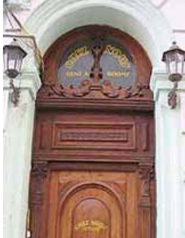
CHEZ NOUS Brasil 115, e/ Cuba y San Ignacio, à deux pas de Plaza Vieja dans VIEJA.