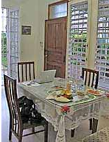
CASA MERCY Calle 68 #4111 e/ 41 y 43 quartier Bélen, à deux pas du Tropicana dans PLAYA.