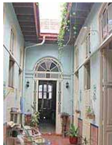
PABLO RODRIGUEZ Compostela 532, e/ Brasil y Muralla, à 2 mins de Plaza Vieja dans VIEJA.