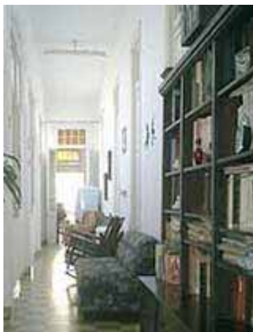
PRISCA y RAUL Calle B No. 707, e/ 29 y Zapata, Plaza de la Revolución dans VEDADO.