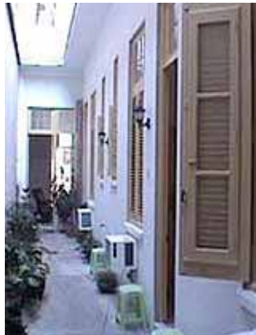
CARY y NILO Gervasio 216, e/ Concordia y Virtudes, près de l'hôpital Almejeras dans CENTRO .