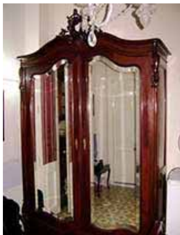
CASA RAY Aguila 309 (2e), e/ Neptuno y Concordia, 3 mins. du parc central dans CENTRO.